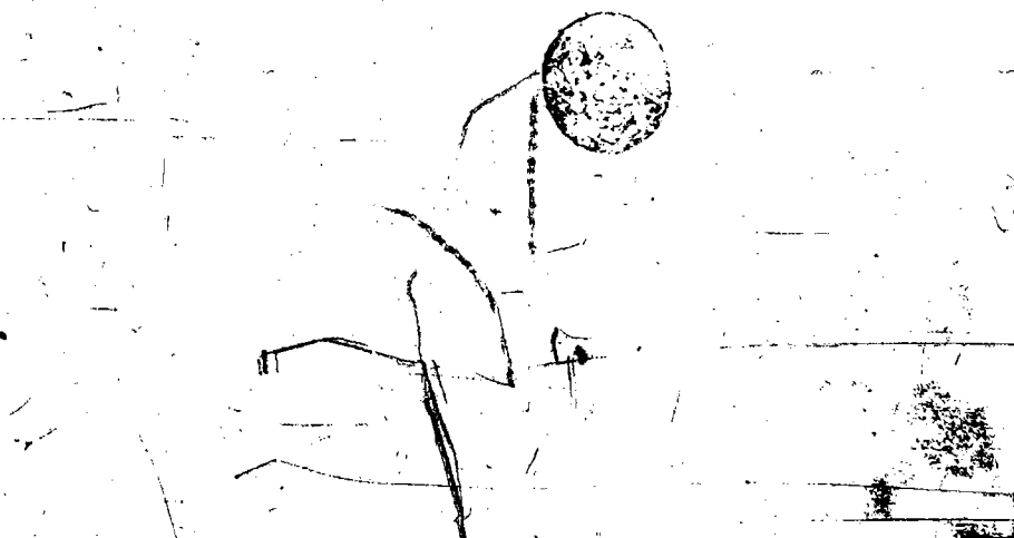
خاتمة الأصل ٨٢

الحكم رسا وادطم حاسد المروعة فدل على ان كل صومع من ليله ورماد عنان الحكم فقدره عند الحكمة ودرسته حتى الامان ومعوق الاثاب وادقايد العار كما عدم فبعض من انهم الحكمة والله اعلم واذلت فطعمهم وانما هم الى السلم والمار والطاركة وروند ذلك قسم في الدوائر على نحو طبقات لا يسرى المستفهم الا انهم ليس من شمول واصولهم في انهم درج الصاكنة ولو كان لهم الدعة اضطرره لكونها قدر الالوان على انهم هم الالوان صاكنة وروهم وكفار كلمة فخر الالهيات وزيج محليهم لها من يد هذه الرسا والنبوغ ودرج المفضلين واستعملهم ان هماد وجد له الالهيات وطبقات الطبقة الشمس والاربع بدرجها عشرين طبقة ودر طبقة منها اما اطل وازر ورطب ودر درج عند الله والله تعالى يجسر الطبع من طه والطبع من طه ونور منها في الالوان والبرهان اجتمعت والابر فالمراد من الالوان واما ما في يد في ذلك الله فان لمراد في الالوان غير الاطبات ارادهم اشد منهم ونظر انهم وقال تعالى واذا النفوس رويت بعد المنظرات بشئ غير الاطبات من غير ان يكون الله فقط ليعرف من الالوان الصاكنة مع الالوان الصاكنة الحكمة ويعرف من الالوان السومع الالوان السومع التار وقال اعلم في انما يلقى طار شعنة الالهوت بالهوت والخرز بالنصار وجمال البصع زختم كشم الالوان مع صاكنة عمله في الامانة ان الالهات صنيع اصل ان يروج البصع من امرها باجسادها ووربها الاله الثاني ان تروجها اولها ما هي انما الهات ان يروج البصع من امرها باجسادها الكف كالتباطين والهل لاول اطرها اقوال والله اعلم ان ذلك يسمى بالالهيات وطبقاتها