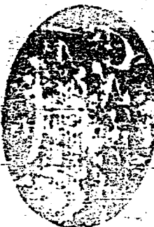
صورة الورقة الأولى من نسخة «ص»