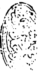
صورة الورقة الأخيرة من نسخة «ش»