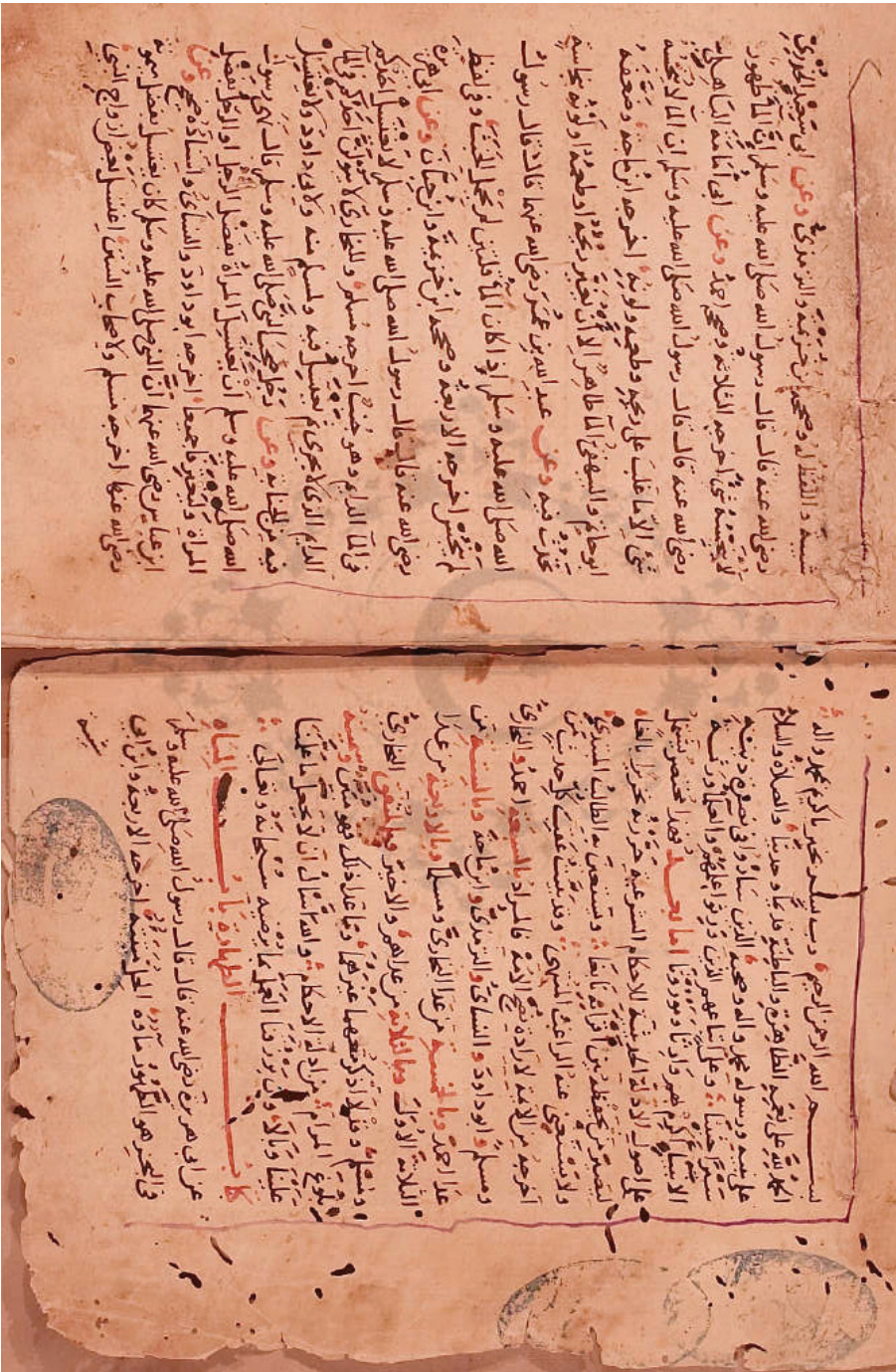
صورة اللوحة الأولى لمخطوطة المكتبة الأزهرية (ب)